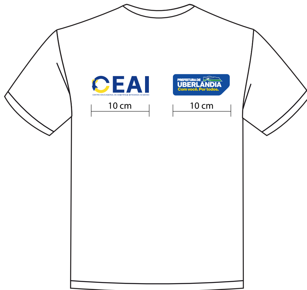
Vista de Costas