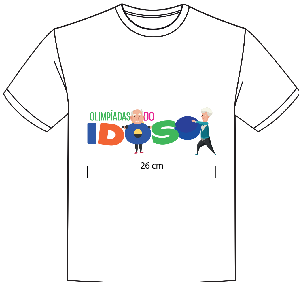
Vista de Frente